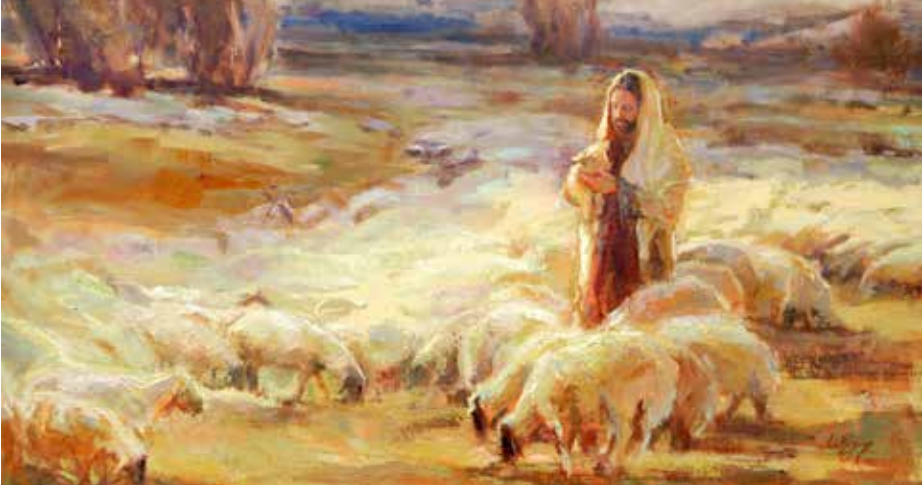
King of Love My Shepherd by Julie Rogers

هذا هو المسيح الملك - غير أنه ملكٌ من طرازٍ جديد، يحمل قصبَةً في يمينه، إليه نشخص بأبصارنا اليوم قليلاً.